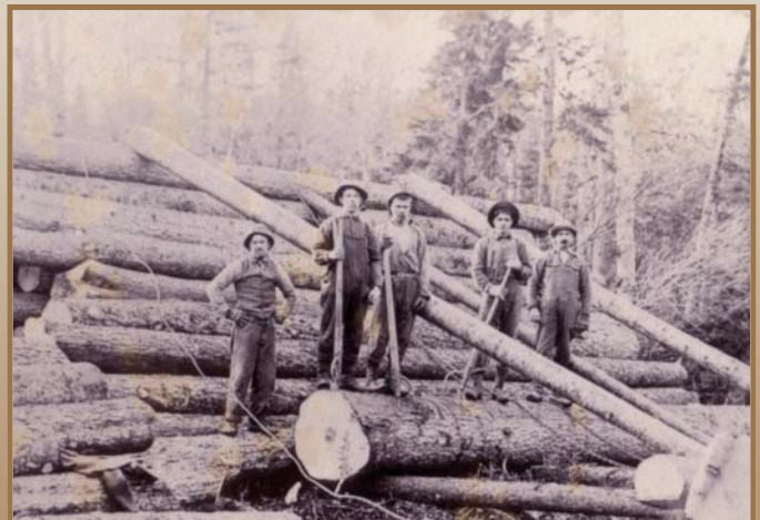
Équipe de draveurs (vers 1900)