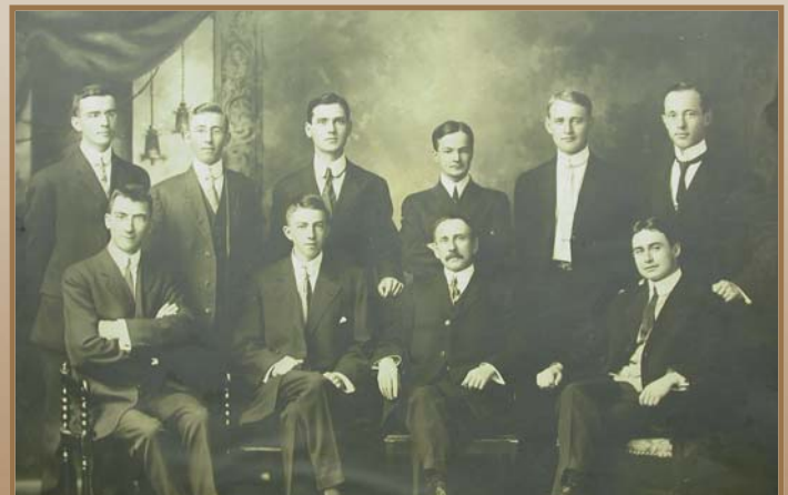
Quatrième promotion de l'École forestière de l'Université Laval (vers 1915)