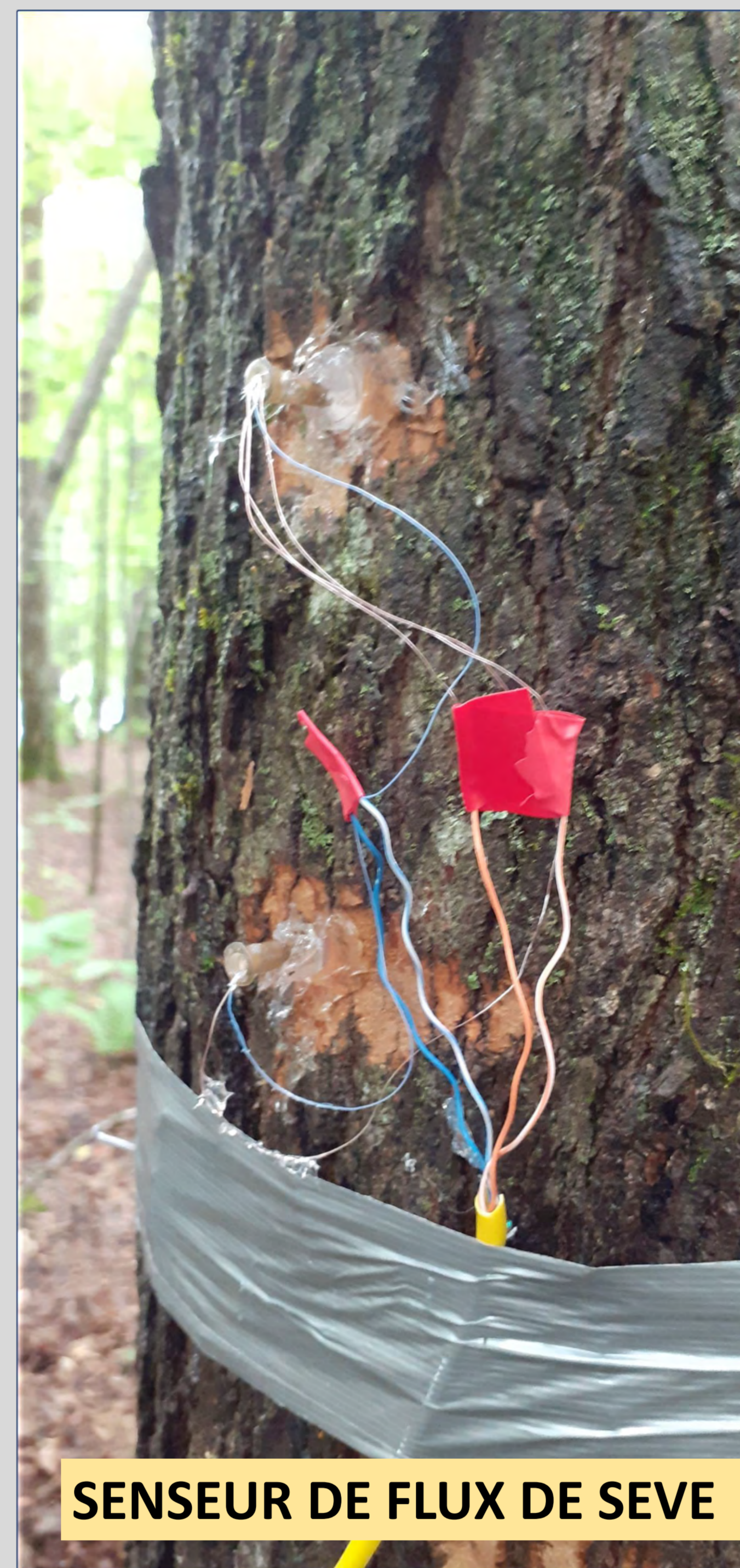
SENSEUR DE FLUX DE SEVE

Évaluer les effets cumulatifs de la prolifération du hêtre et de la sécheresse sur l'utilisation de l'eau à l'échelle de l'arbre et sur la transpiration à l'échelle du peuplement dans les érablières québécoises