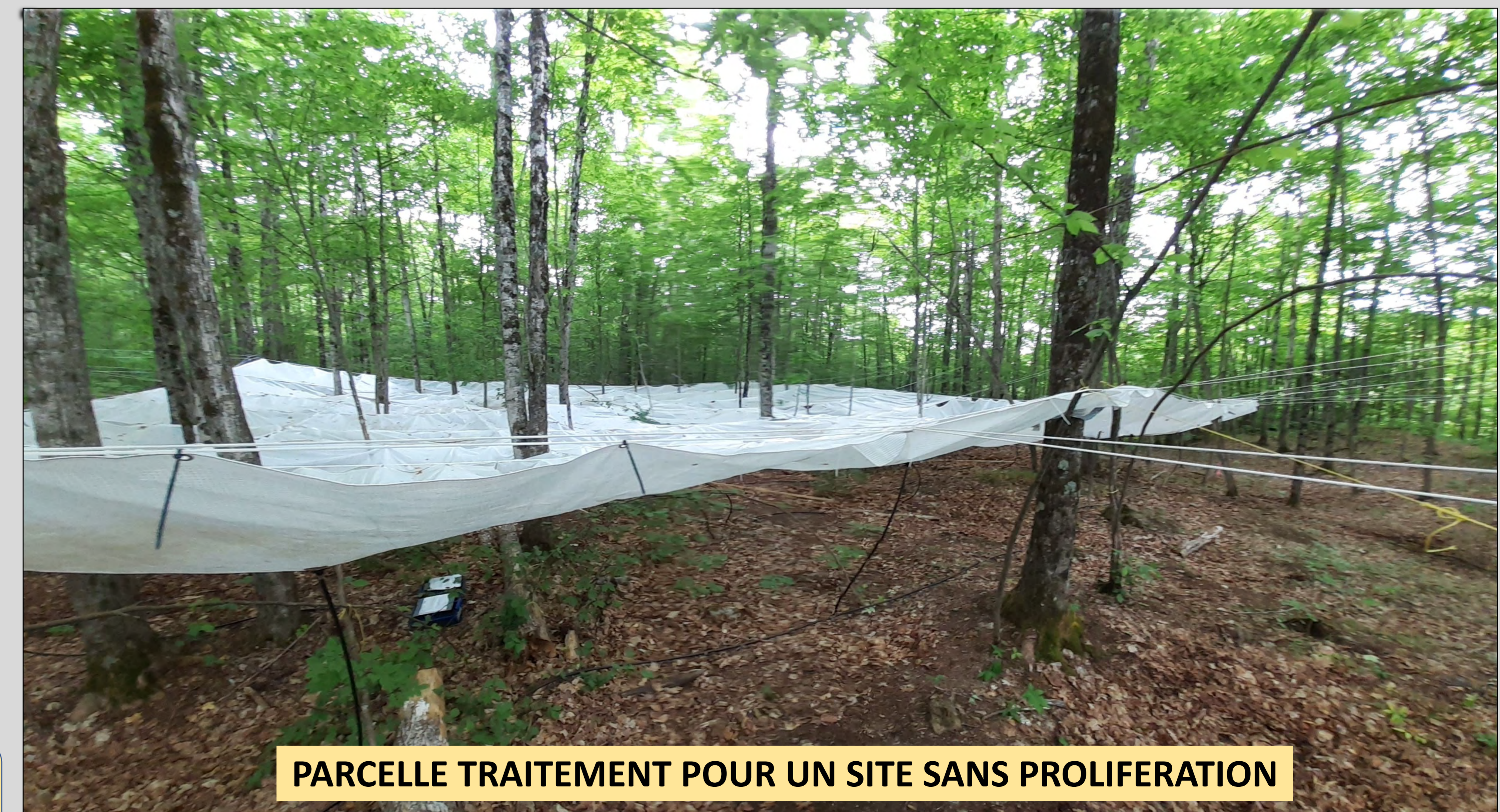
PARCELLE TRAITEMENT POUR UN SITE SANS PROLIFERATION