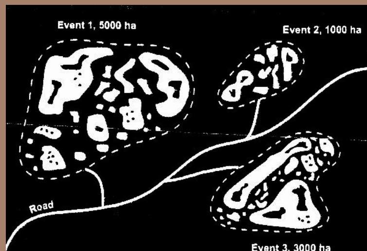
Figure 2. Exemple d'aires de coupe compatibles avec les effets du feu. Ces aires et les îlots résiduels sont de formes et de tailles variées et le tout est regroupé par « événement de feu » (tiré de Kimmins 2004)

Les implications de ces différences dépendent de deux facteurs. Tout d'abord, leur importance dans le paysage forestier. Ces différences deviennent problématiques lorsqu'on les retrouve à de grandes échelles, car elles tendent à homogénéiser les mosaïques forestières sur des surfaces plus grandes que l'on aurait pu observer historiquement. Il faut également être conscient que plus les conditions créées par les coupes diffèrent de celles rencontrées à la suite d'un feu, moins il sera possible de maintenir et de conserver les habitats et la biodiversité. La situation rencontrée en Finlande illustre bien les effets de coupes qui ne s'inspirent pas des perturbations naturelles. L'aménagement intensif à grande échelle, réalisé durant le dernier siècle, a graduellement remplacé les forêts naturelles par de jeunes peuplements de conifères équiens et purs que l'on éclaircit régulièrement afin de maximiser leur productivité et de récupérer les arbres faibles et mourants. Un programme efficace de contrôle des feux et le fort