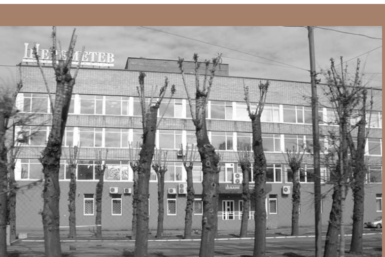
La foresterie urbaine semble être prise au sérieux en Russie en constatant l'ampleur de certains projets comme l'élagage des peupliers. Ceux-ci sont très utilisés en ville comme arbre d'enlignement et on les rabat périodiquement.