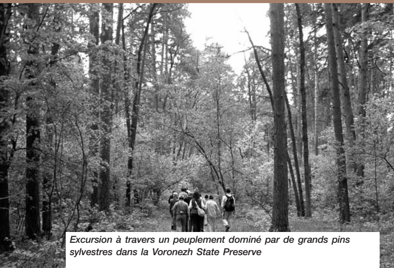
Excursion à travers un peuplement dominé par de grands pins sylvestres dans la Voronezh State Preserve